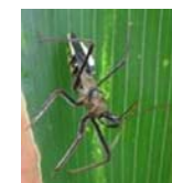
Bọ sát thủ ăn ấu trùng